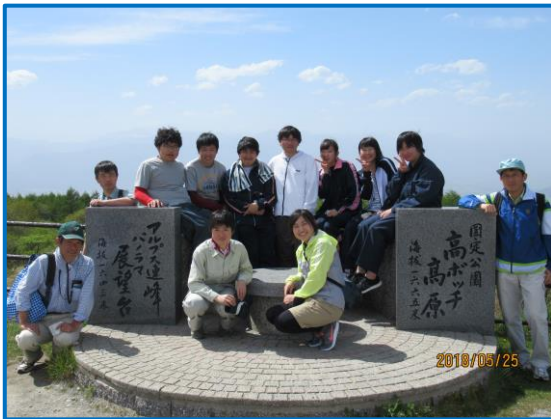
高ボッチ高原演習