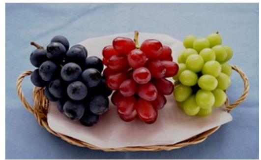
<参考> 「クイーンルージュ」の特徴