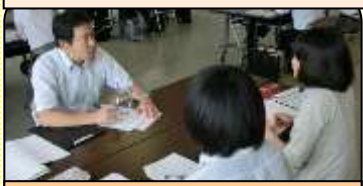
第3回 助言者の教頭先生 と共に授業づくり