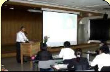
第1回 具体的な事例を交えて 教師の姿勢・心構えを学ぶ