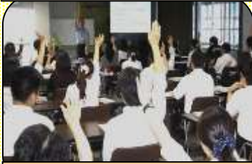
第2回 「“できない” 気持ち とは？」体験を通して学ぶ