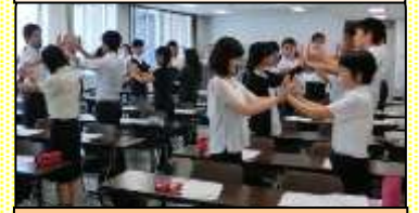
仲間と関わる心地よさを体験 する学級づくりのミニワーク