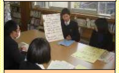
第5回 授業から学んだこと をポスターで発表し合う