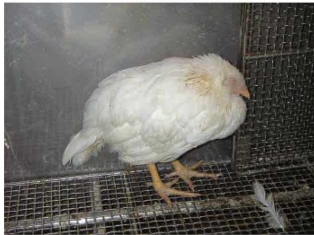
高病原性鳥インフルエンザウイルスに感染し、元気をなくしている鶏

➤ 鶏に元気がない場合やほぼ同時期に複数羽が死ぬ場合は、すぐに獣医さん（家畜保健衛生所、動物病院）に相談して、指示を受けましょう。