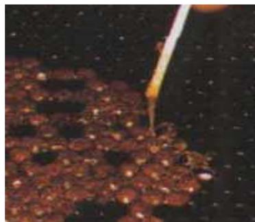
アメリカ腐蛆病 (糸を引く蜂児)