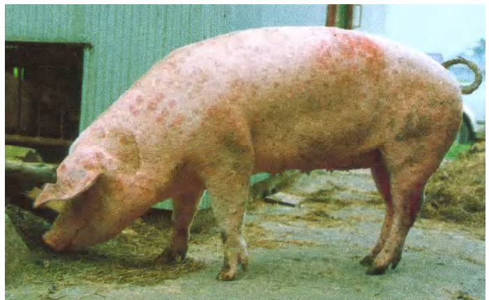
蕁麻疹型の発症豚 (畜産図鑑第1巻、1985、全国農業共済協会)