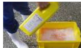
鶏舎毎の消毒実施