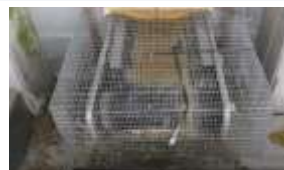
開口部の隙間対策