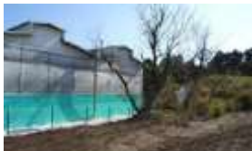
周囲の樹木の剪定