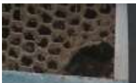
金網等の破損修繕