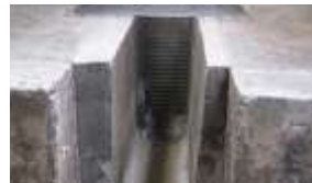
排水溝の侵入対策