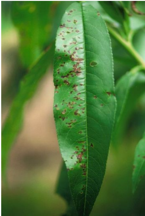
葉の被害 5月頃からみられ、病斑部は褐色、不整形で部分的にせん孔する