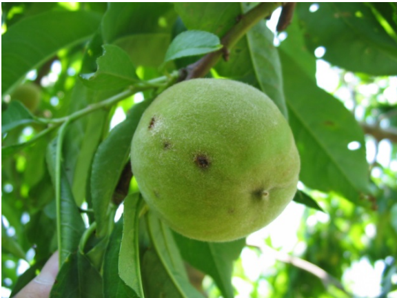
果実の被害 褐色の微小な病斑を生じ、果実の生長に伴い深い亀裂のある病斑になる。