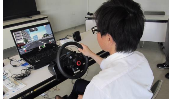
エコドライブシミュレーターの様子