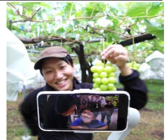
（9月開催オンラインぶどう狩りの様子）

※2： オンラインりんご狩り は、東京駅と長野のりんご園をオンラインでつなぎ、農家からおいしい食べ方やりんごの豆知識などを楽しく学びながら、りんご狩りが体験できます。（協力：Qtas Japan合同会社（本社：横浜市））