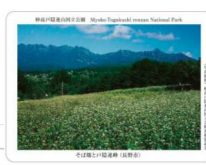
(a)そば畑と戸隠連峰

(妙高戸隠連山国立公園4種類(a),(b),(c),(d)、上信越高原国立公園2種類(e),(f))