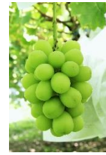
(シャインマスカット)

皮ごと食べることのできる種なしの大粒ぶどう。丸ごと頬張ると、さわやかな果汁と芳しいマスカットの香りがはじけます。果肉が締まっていて日持ちの良いことも特徴です。