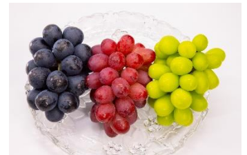
（左から、ナガノパープル、クイーンルージュ ® 、シャインマスカット）