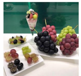
（昨年のカルチャースクールの取組の様子）

取材を希望される場合は、9月27日（月）12:00までに、長野地域振興局 長野農業農村支援センター農業農村振興課までお申込み願います。