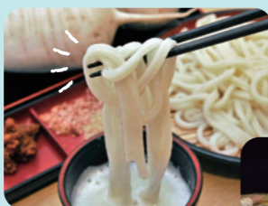
辛味大根を絞った汁につけるおしぼりうどんが名物!