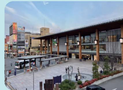
長野駅から東京まで新幹線で90分