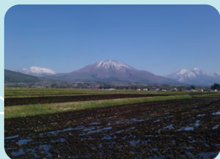
アイデンティティとなる北信五岳