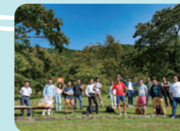
若者からお年寄りまで地域内外の交流が盛んです!