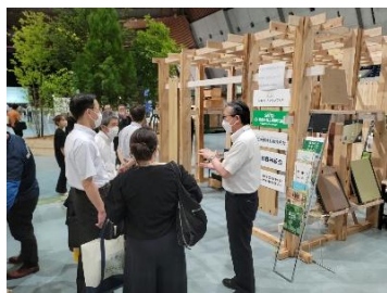
(実施例：展示会への参加)

製材工場と工務店等が連携して行う、エンドユーザーに向けた県産木材を使用した住宅をPRする取組