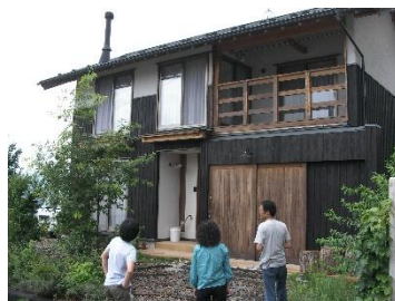
(実施例：住宅見学会)