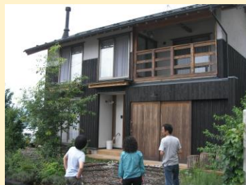
(実施例：住宅見学会)