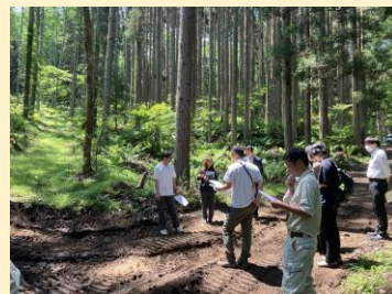
(実施例：山の現場見学会)