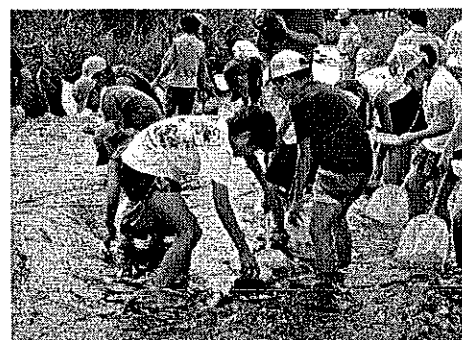
<エコクラブ「水生生物観察会」>