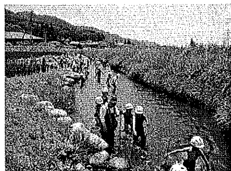
<多自然川づくり(農具川:大町市)>