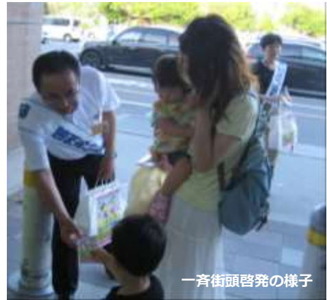
一斉街頭啓発の様子

※「青少年の非行・被害防止全国強調月間」とは 内閣府が7月を「青少年の非行・被害防止全国強調月間」と定め、家庭、学校、地域住民、企業、団体及び行政が一体となり、子供の性被害の防止や有青少年の健全育成のための広報・啓発活動を集中的に実施するものです。