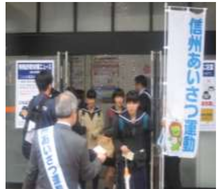
—あいさつ運動も併せて行います—

※「信州あいさつ運動」 大人が子どもにあいさつをすることで、子どもを元気づけ、地域ぐるみで子どもの育ちを応援する運動です。 毎月11日は「信州あいさつの日」です。