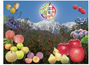
果樹栽培百年 松川町