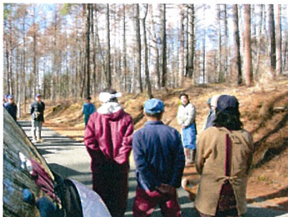
青年部長より作業説明