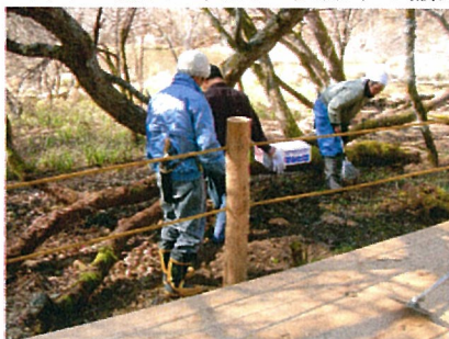
倒廃木等の除去作業状況