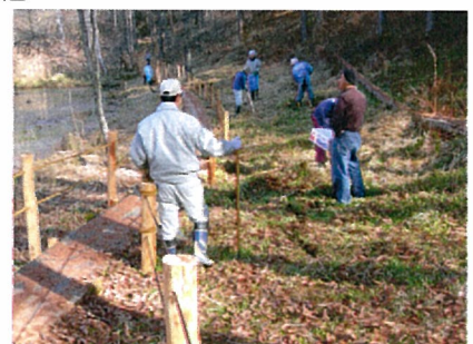
九輪草の種蒔き状況