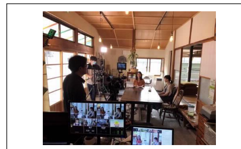
【オンラインツアーの様子】