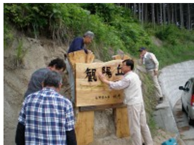
地区の皆さんによる入口看板 設置の様子（書は村井知事）