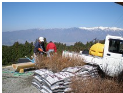
観陽丘整備の様子 （後方は中央アルプス）

観陽丘からは、西は中央アルプスや恵那山、遠くは愛知県境の茶臼山まで見渡せ、東は南アルプス・塩見岳を見ることができます。