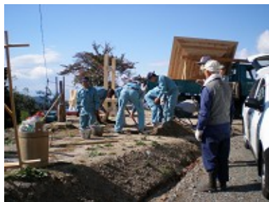
伊那技術専門学校生徒による 東屋設置の様子