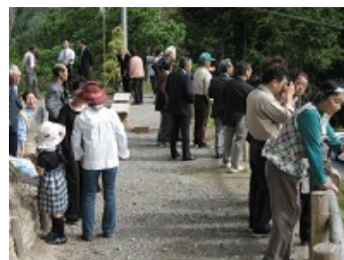
観陽丘からの眺めを堪能する 地区の皆さん

朝から夕方まで太陽を観ることができる「観陽丘」、皆さんもぜひ訪れてみてください。