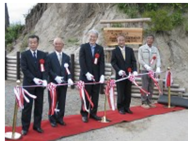
テープカットの様子