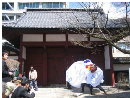
平成 31 年 4 月「赤門開門式」の様子

正式名称 飯田城桜丸御門 (江戸時代の宝暦 4 年(1754 年)に上棟) 飯田城唯一の遺構であり、飯田市有形文化財に指定されています。 平成 22 年には、大規模改修工事を行いました。