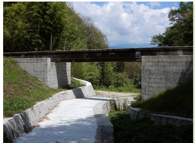
【水路橋の耐震補強（飯田市）】