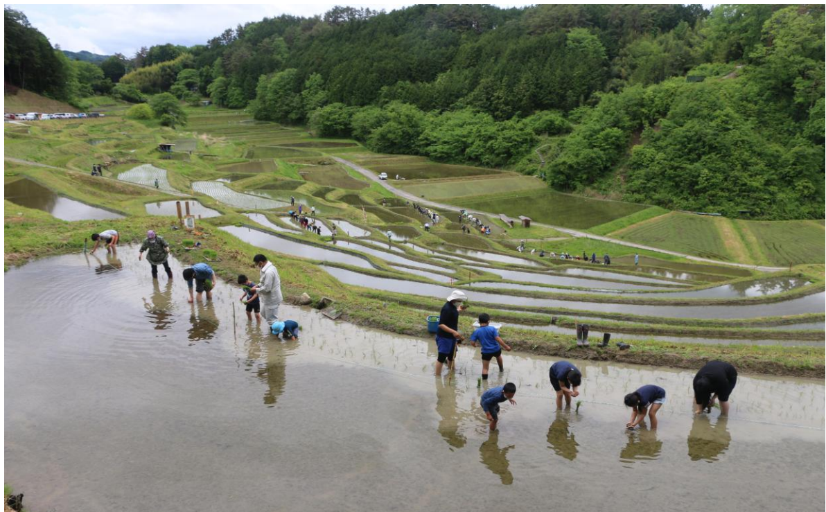
よこね田んぼの田植え体験イベント