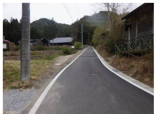
農道の改良 ( 県営中山間総合整備事業 花桃の里地区 )