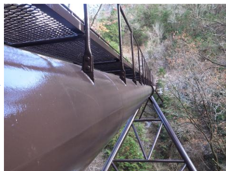
補修が完了した生田寺沢川サイフォン(竜東一貫水路)