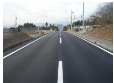
傷んだ路面を県営農道整備事業で改良（広域農道伊那南部2期地区）