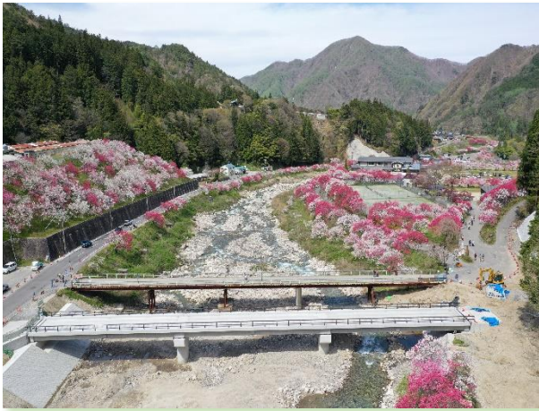
【集落道の整備（阿智村）】