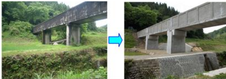
耐震補強が完了した胡麻目沢水路橋（竜西一貫水路）

そのため、該当施設に対して機能診断を行い、必要な補修・更新工事等を実施しています。