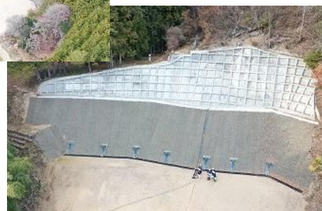
地すべりにより崩落した斜面へ対策工事を実施（地すべり対策事業 平久地区）