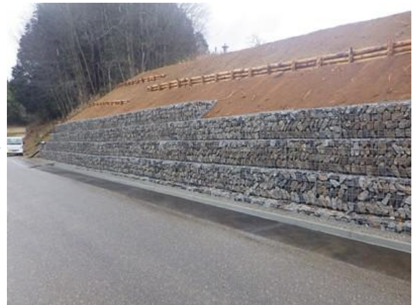
令和7年発生災害の復旧状況（下條村 農地・水路）