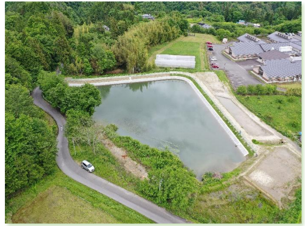
【ため池堤体の耐震改修（阿南町）】