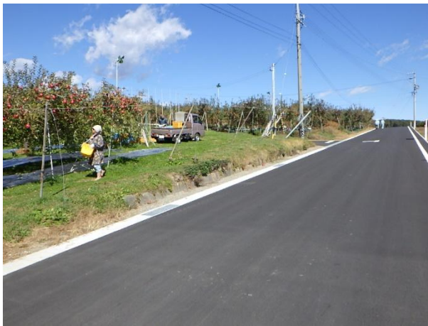
【農園観光に向けた道路の拡幅（高森町）】