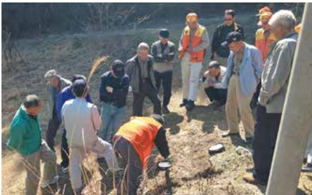
有害鳥獣捕獲講習会 (猟友会主催)