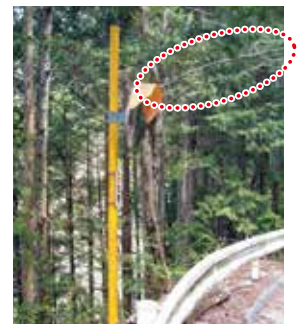
支障となる枝の伐採 →立木の損傷