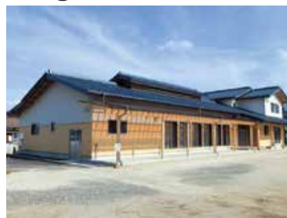
上山自治会（飯田市） 県産材の需要拡大に貢献