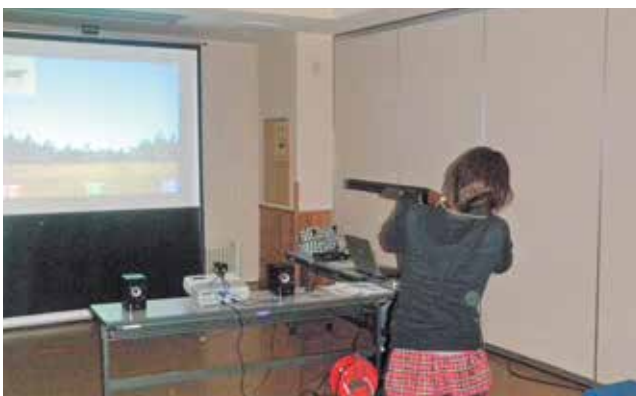
シミュレーターを用いた射撃体験 (猟友会主催)