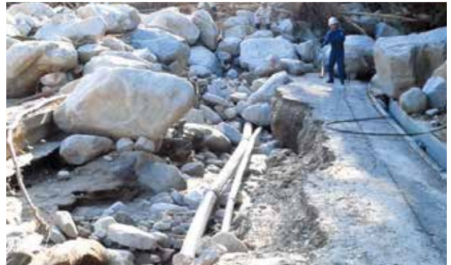
土石流による村道の被災 集落

平成25年9月16日に台風18号の豪雨により阿智村伍和で土石流災害が発生しました。このほど、その伍和集落の上流に約2億円の事業費で治山ダム4基が完成しました。