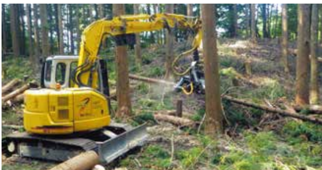
飯伊森林組合集約化推進施業管理チーム(飯田市) 森林整備・木材の安定供給に貢献