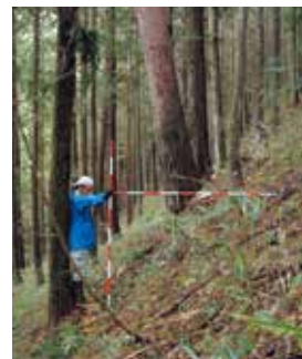
作業道の開設 →土地の改変