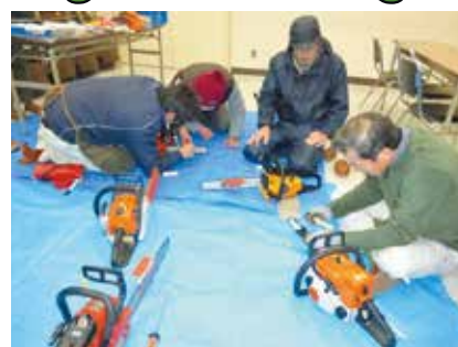
松川青年の家（松川町） 様々な森林整備研修等実施