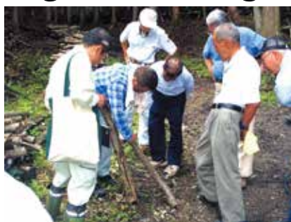
下條村きのご振興会（下條村） 乾しいたけによる地域振興