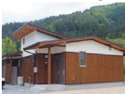
大鹿村村営住宅「からまつの家」（大鹿村） 地域材の活用・PR