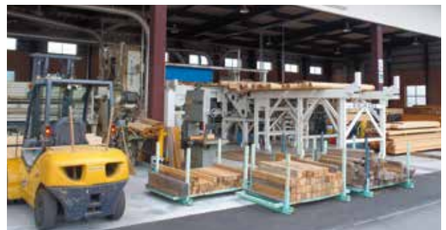
(株)飯伊(喬木村) 地域材の効率的な加工と需要の拡大