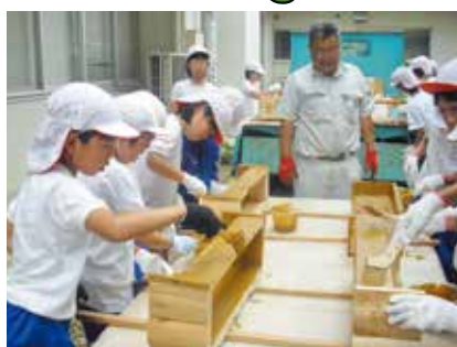
（有）富辻建築 地域の小学生への木育活動