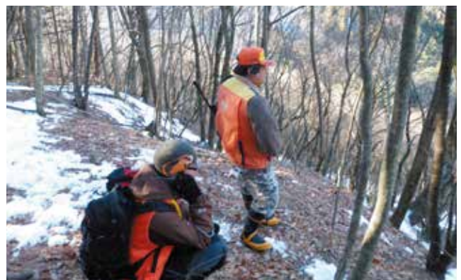
銃猟講習 (講師と受講生)