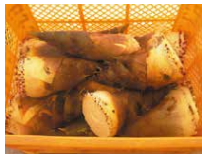
株外松（飯田市） 地域の山菜の活用に貢献