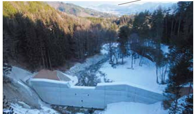
治山ダム (L=58.2m H=10.0m)