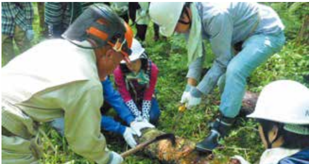
(株)八十二銀行(長野市) 森林整備・環境保全に貢献