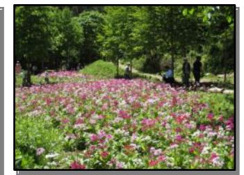
九十九谷森林公園内のクリン草