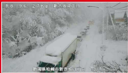
令和4年12月19日 国道8号(登坂不能車による交通障害の発生状況)