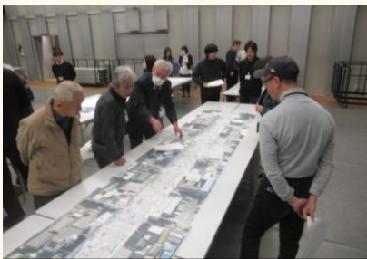
全体での意見の共有

グループワークでは、計画案に示した6つの実現イメージについて、「自分はこう関わってみたい」「こういう関わりができそう」といった各自の関わり方や、取組に関連する団体・グループ・キーパーソンに関する情報を付せんに書き出し、グループ内で共有しました。