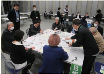
グループごとの意見出し・共有

第5回ワークショップでは、前回のワークショップでの意見を反映し取りまとめた「あがたの森通り再整備計画(案)」を提示し、事務局から内容について説明しました。