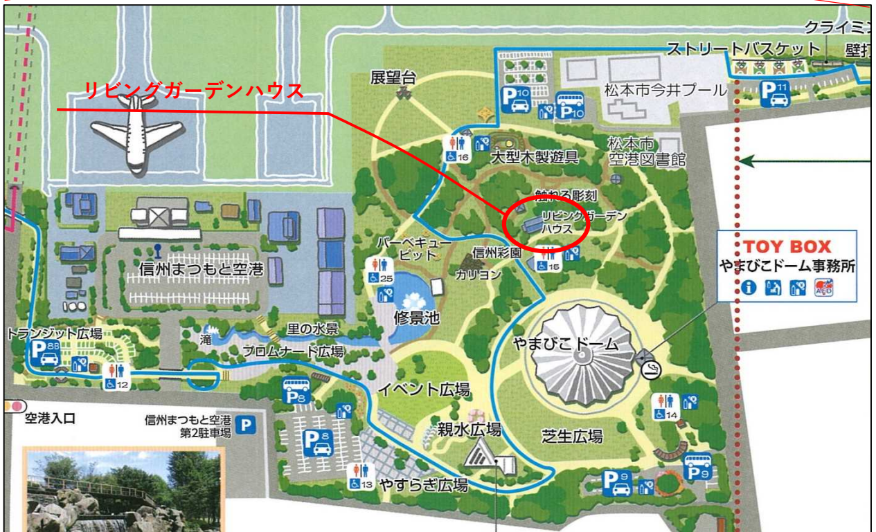
デイキャンプ イメージ