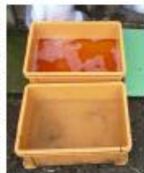
推奨される 踏込消毒槽の設置方法