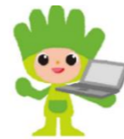
長野県ものづくり人材育成応援キャラクター わざまる