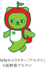
長野県PRキャラクター「アルクマ」 ©長野県アルクマ

■ 訓練施設・募集定員 松本情報工科専門学校（NM06-05） 4名程度 （松本市城西）