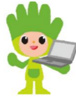
長野県ものづくり人材育成応援キャラクター わざまる