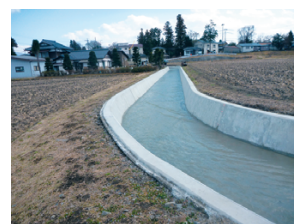
【更新した新村堰水路（松本市）】