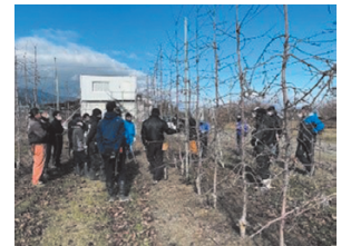
【りんご高密度植栽培ほ場せ ん定指導会】