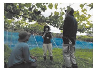
【新規就農者現地指導】