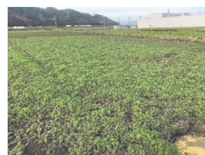
【風食対策ハゼリソウ栽培試験】