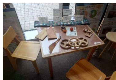
↑ 昨年度別イベントでの木工品展示の様子

※古くは江戸時代から家具産業が発展してきた松本地域は、大正から昭和にかけての民芸運動を経て、1980年代以降は「民芸とクラフトの街」として広く知られています。現在、管内には木工品を製造する企業や個人が100以上存在し、伝統的な和家具から地元産の木材を使った多彩な木工品まで、幅広く開発・製造されています。