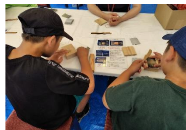
↑ 昨年度別イベントでの木工ワークショップの様子 (上) 箸作り (下) バターナイフ作り