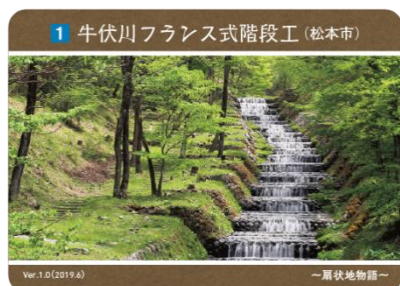
(近代化遺産カード参考-牛伏川フランス式階段工)