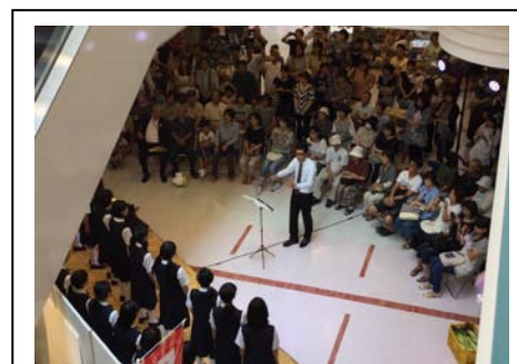
【收音祭アイシティ会場の様子】