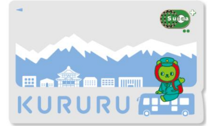
「KURURU」は長野市公共交通活性化・再生協議会の登録商標です