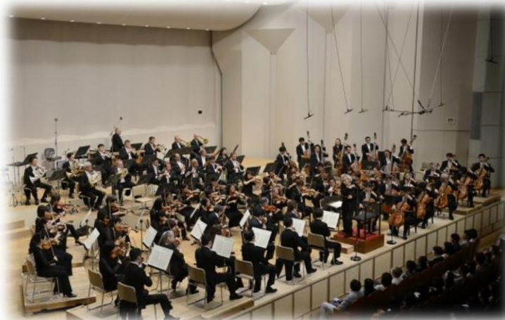
毎夏、開催される音楽祭 セイジ・オザワ松本フェスティバル