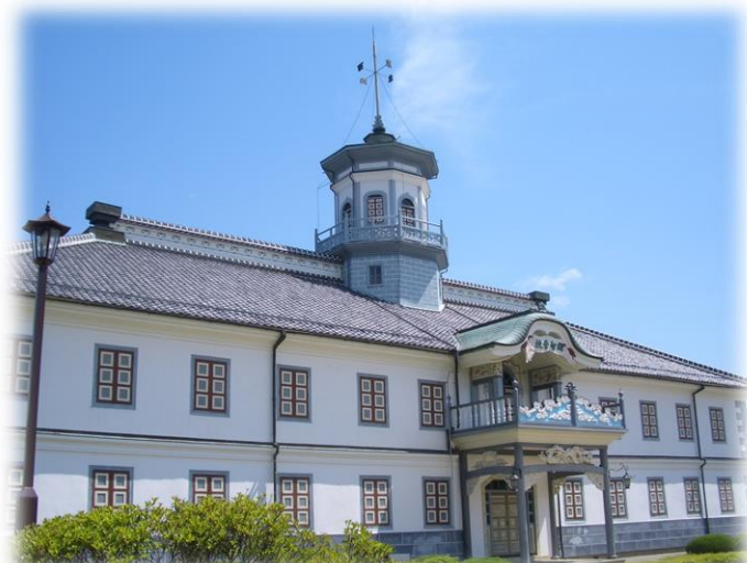
国宝 旧開智学校校舎