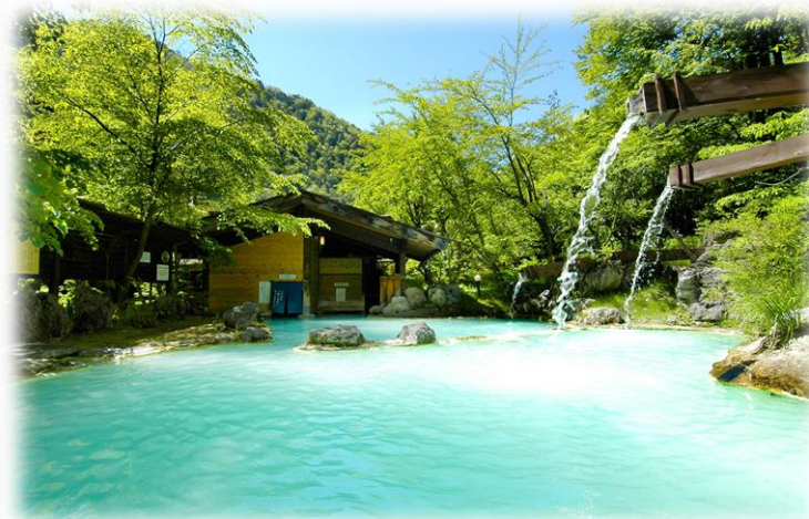
市内16か所に温泉地