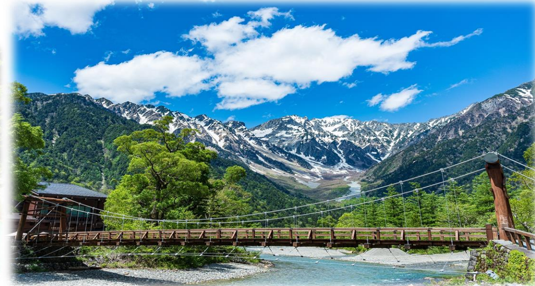
特別名勝・特別天然記念物 上高地