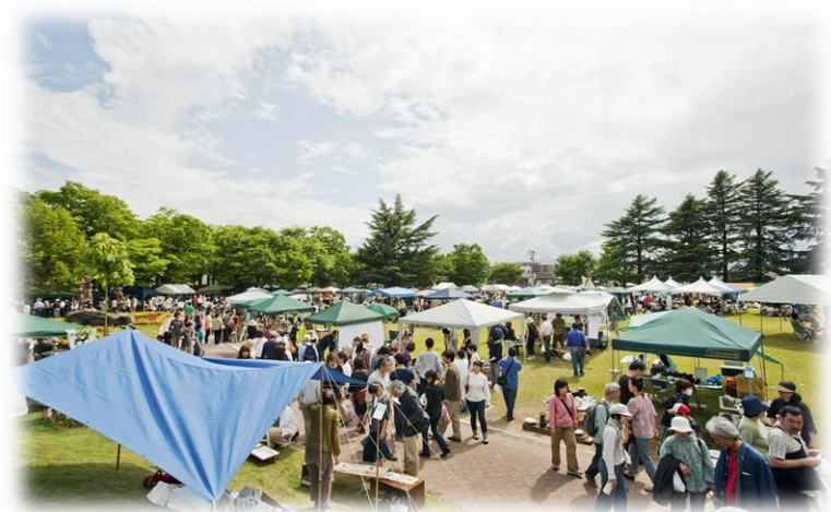
全国でも有数規模のクラフトフェア クラフトフェアまつもと