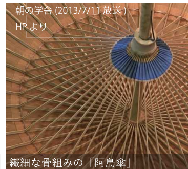
朝の学舎 (2013/7/11 放送) HPより