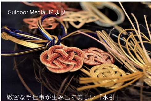
Guidoor Media HPより