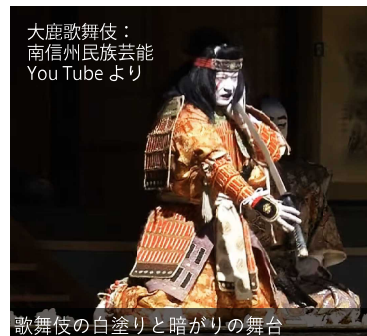
大鹿歌舞伎： 南信州民族芸能 YouTubeより