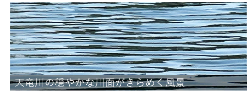
天竜川の穏やかな川面がきらめく風景