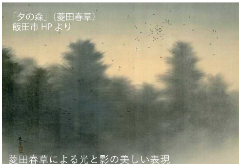
「夕の森」(菱田春草) 飯田市 HPより