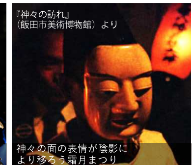
『神々の訪れ』(飯田市美術館)より