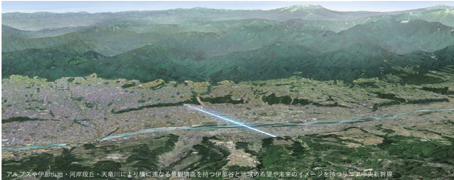
アルプスや伊那山地・河岸段丘・天竜川により横に連なる景観構造を持つ伊那谷と地域の希望や未来のイメージを持つニア中央新幹線