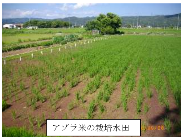
アゾラ米の栽培水田

私達の小さな活動が、「安全な食料生産と生物や人に優しい農業先進地・佐久」を目指すきっかけとなることを願い、今後も地域と一緒に「アゾラ・プロジェクト」に取り組んでいきたいと思っています。