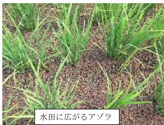
水田に広がるアゾラ