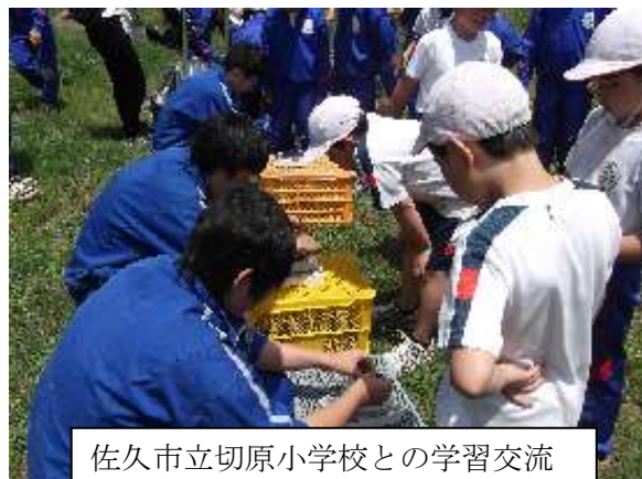
佐久市立切原小学校との学習交流