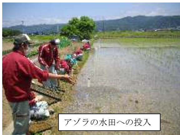
アゾラの水田への投入