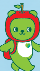
長野県PRキャラクター「アラクマ」