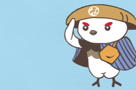
学び応援キャラクター「信州なび助」 ©長野県教育委員会信州なび助