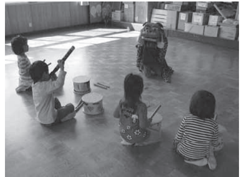
地域の伝統行事を保育に生かして ～手作り獅子舞～