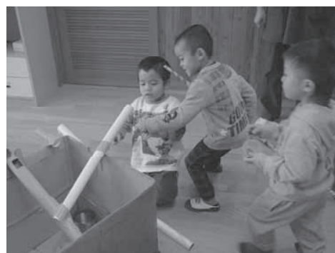
子どもの主体性を大切にした保育環境 ～どンドン広がるどんぐり迷路～