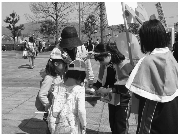
外国籍児童就学支援(サンタ・プロジェクト)の募金活動