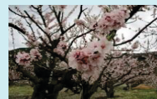
(千曲市 あんずの里)

「北信ブロック」は、上信越高原国立公園の山々に囲まれ、千曲川中流の豊かな流れのもとに広がる地域です。この自然環境の中で、様々な産業が営まれ、善光寺をはじめ多くの観光地・温泉地・伝統文化・おいしい食べ物等、多彩な魅力にあふれています。県庁所在地・長野市を中心として経済・交通が発展しています。