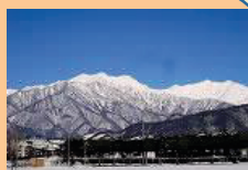
(学校から望む 冬の北アルプス)

「中信ブロック」は、北アルプス・御嶽山の麓、南北140kmに連なる地域です。 (学校から望む 冬の北アルプス) 安曇野の水田、松本の城下、塩尻のワイン醸造地、木曾路の町並み等、各地の気候・風土を背景にした、豊かな「ひと・もの・こと」が息づいています。スポーツや芸術も盛んで多様な文化に触れることができます。