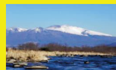
(冬の千曲川と浅間山)

「東信ブロック」は、佐久地域と上田小県地域に分けられます。千曲川・浅間山・八ヶ岳連峰の豊かな自然に囲まれ、新幹線など高速交通網が発達しています。ブランド化された農産物、先進技術を誇る工業、文化でも国際化が進み、「多様性」に富んだ魅力と夢にあふれた地域です。