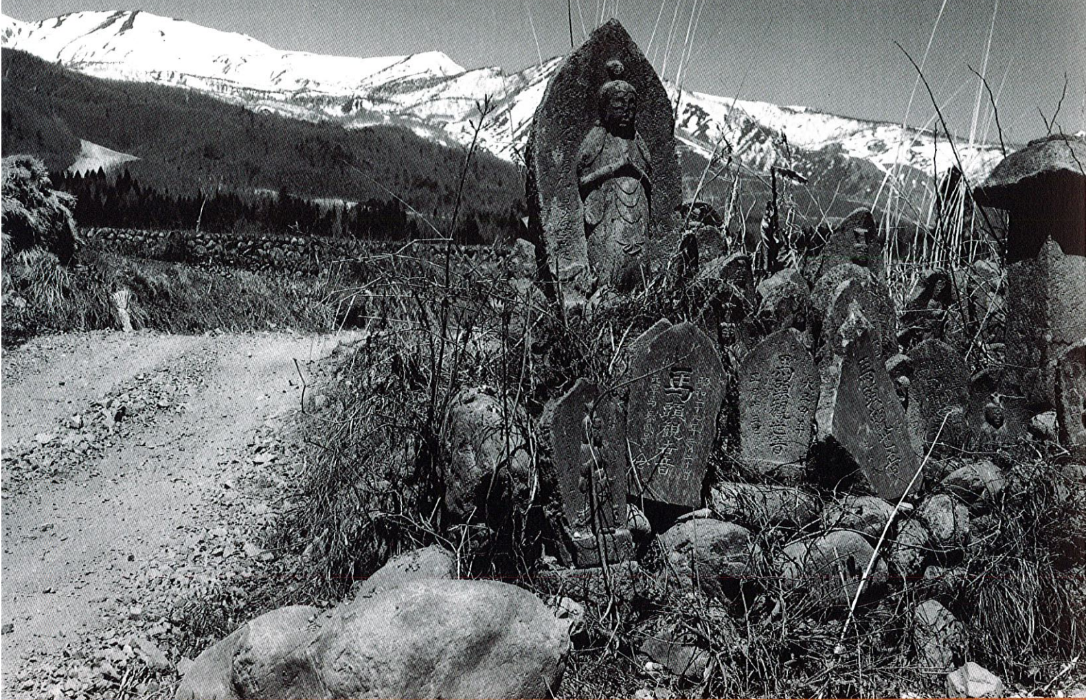
《安曇野に多い石仏や碑》1970年、田淵行男記念館蔵