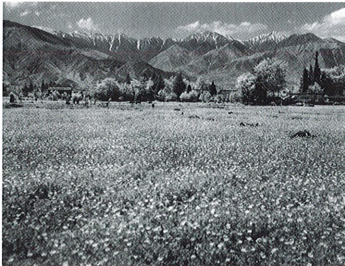
《安曇野田園風景 レンゲ田》1960年代、田淵行男記念館蔵