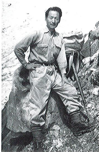
田淵行男(常念一ノ沢にて、1955年)