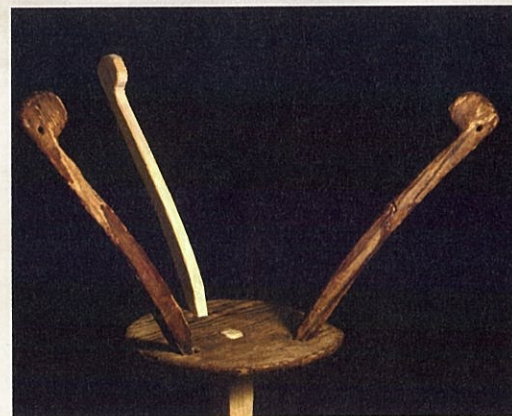
甲斐銚子塚古墳出土木製品(山梨県立考古博物館蔵)