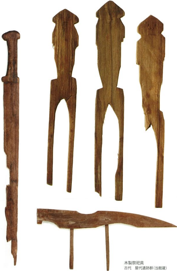
木製祭祀具 古代 屋代遺跡群(当館蔵)