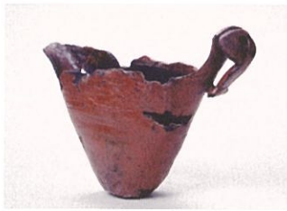
赤漆塗り木製容器 縄文時代 分谷地A遺跡(新潟県胎内市教育委員会蔵)