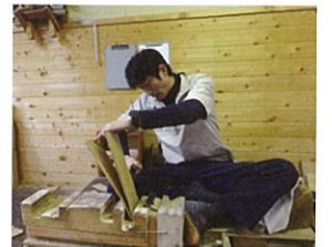
伝統的木造建築物屋根材の製作 (協力: 栗山木工有限会社)