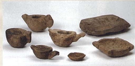
製作途中の割物 縄文時代 御井戸遺跡(新潟市文化財センター蔵)