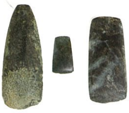
磨製石斧 縄文時代 屋代遺跡群(当館蔵)