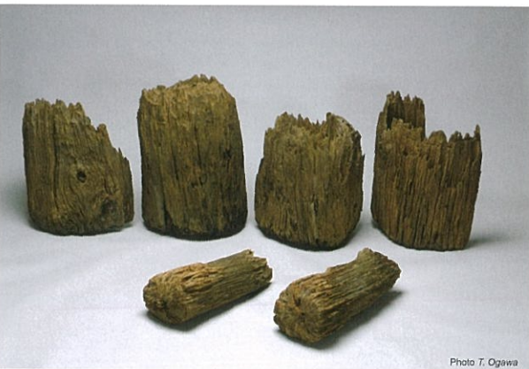
掘立柱建物柱材 縄文時代 青田遺跡(新潟県埋蔵文化財調査事業団蔵)