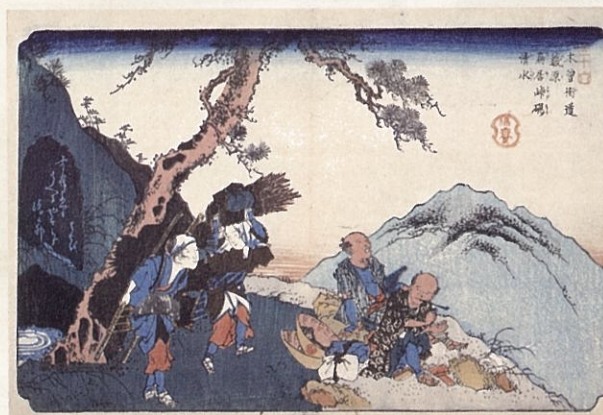
深斎英泉 木曾街道藪原鳥居峠硯清水 江戸時代(木曾路美術館蔵) ※半期のみ展示