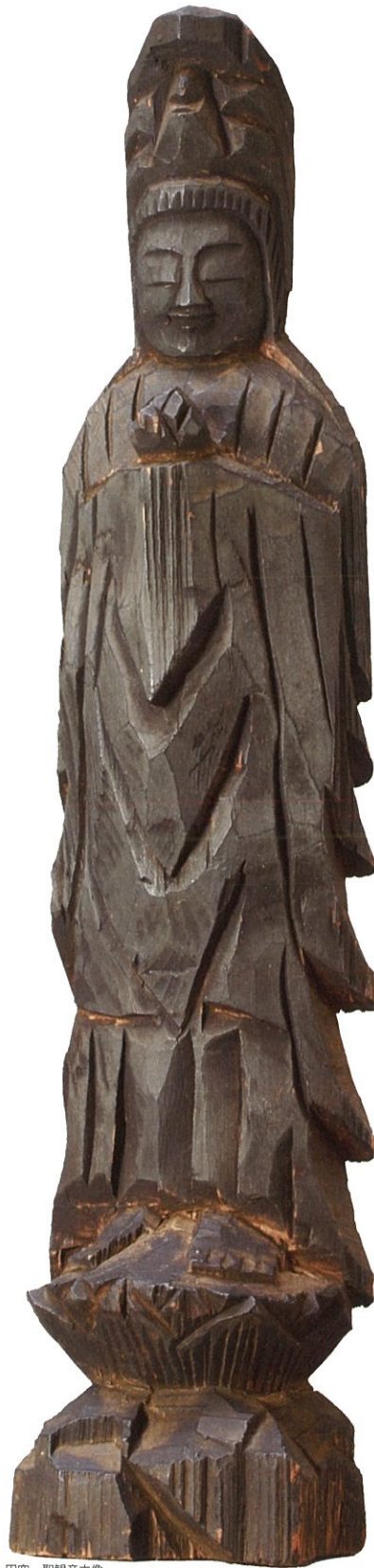
円空 聖観音立像 江戸時代(個人蔵)