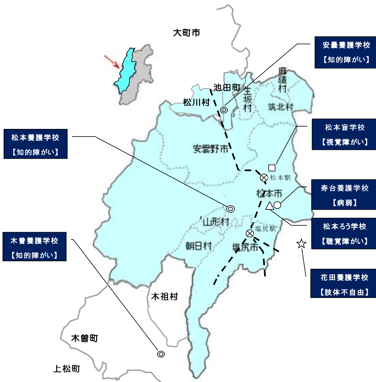
中信地区特別支援学校の配置