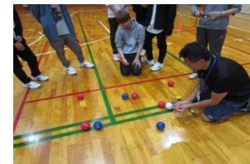
《スポーツデイ：ボッチャ》