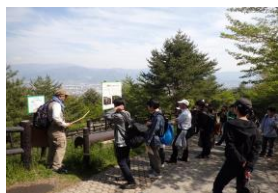
《信州学：地附山地滑りについて》