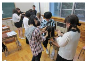
《キャリアガイダンス》