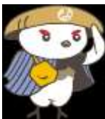
学び応援キャラクター「信州なび助」 ©長野県教育委員会信州なび助