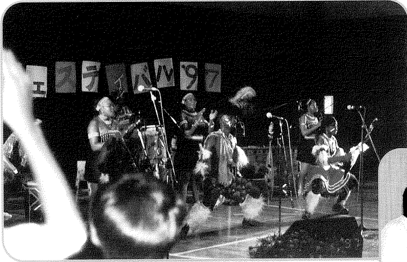
地域ぐるみの国際交流フェスティバル 外国の芸能グループを村に招き、各家庭に宿泊してもらい、地域ぐるみで交流をしました。